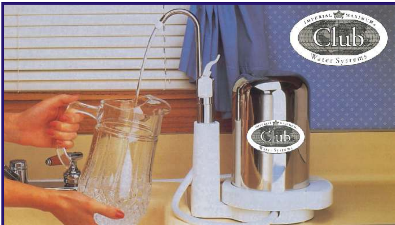
K6845 (Συστήματα πάνω από τον νεροχύτη)

Προκειμένου να μπορούμε να γεμίζουμε τα δοχεία πιο εύκολα, η βρύση περιστρέφεται ανά 360 μοίρες. Η βρύση τοποθετείται σε ειδική θέση για να γεμίζουμε εύκολα τα δοχεία μεγάλου μεγέθους.